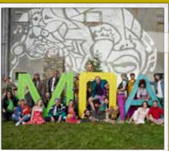
MUSIKCLUB OPEN AIR