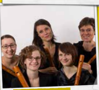
DIE ANATOMIE DER MELANCHOLIE