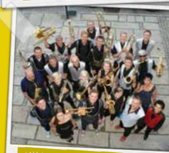
MVA BIG BAND & FRIENDS