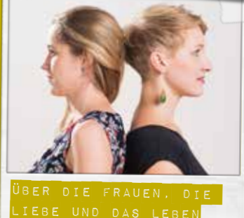
ÜBER DIE FRAUEN. DIE LIEBE UND DAS LEBEN