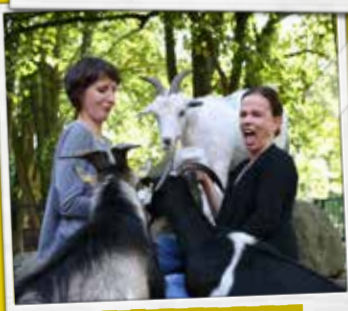
DIE MÄDCHEN UND DIE FAMILIE