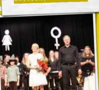
MACHOS E MAFIOSI